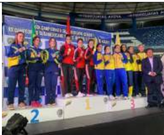
PARTICIPACIÓN SURAMERICANO KARATE-DO