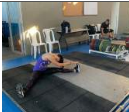
CONCENTRACIÓN NACIONAL LIGA DE PESAS