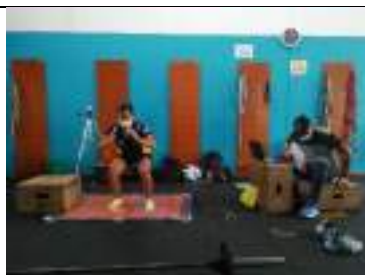
Evaluaciones Técnico Metodológicas a deportistas proyección a juegos deportivos nacionales