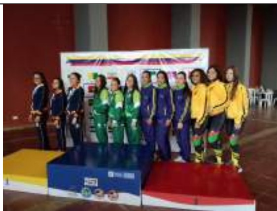
PARTICIPACIÓN NACIONAL LIGA DE KARATE-DO