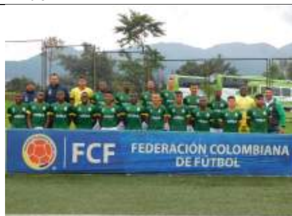
Campeonato Nacional Interligas de Futbol sub 15