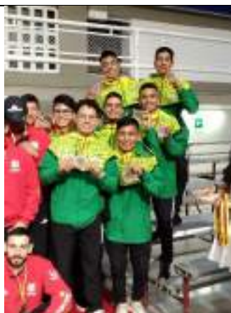
PARTICIPACIÓN NACIONAL LIGA DE KARATE-DO