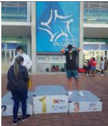
PARTICIPACIÓN NACIONAL DE LIGA DE SUBACUÁTICAS