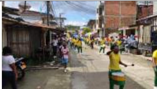
Inauguración Juegos Intercolegiados Municipales Timbiquí Cauca