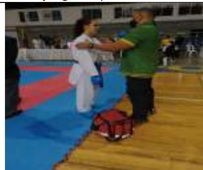
Acompañamiento fisioterapéutico En eventos nacionales