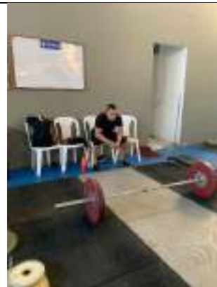
CONCENTRACIÓN NACIONAL LIGA DE PESAS