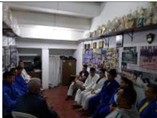
Reunión con ligas deportivas Juegos Deportivos Nacionales 2023