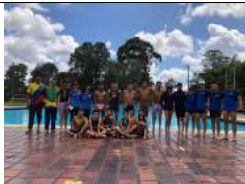
Sección de entrenamiento de Triatlón