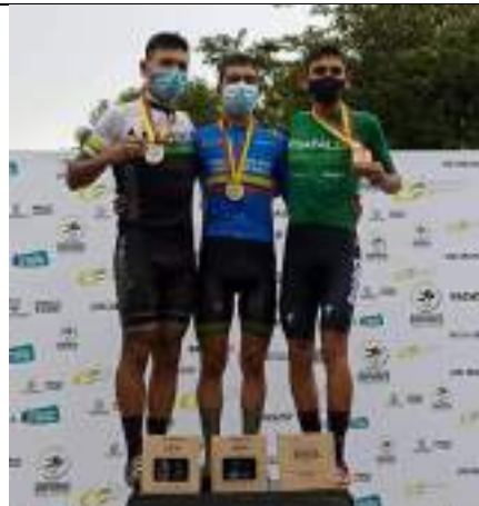
PARTICIPACIÓN NACIONAL LIGA DE CICLISMO