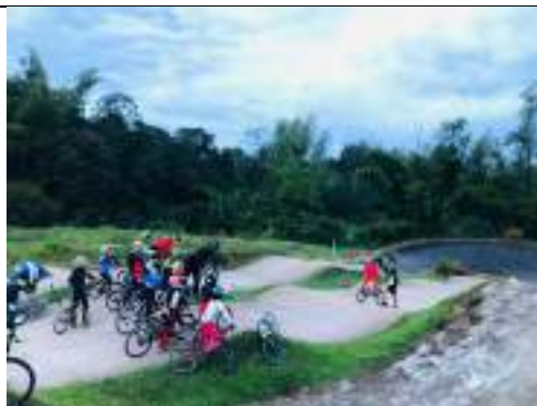
Sección de entrenamiento de BMX pista de Timbío