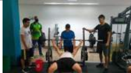
Preparación física específica deportistas proyección a juegos deportivos nacionales