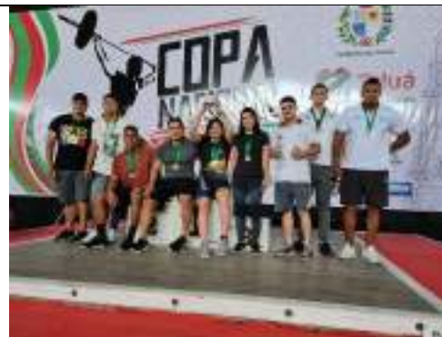
Copa Nacional de Levantamiento de Pesas