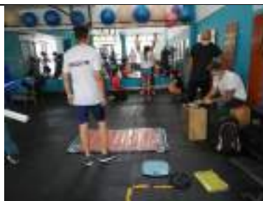
Evaluaciones Técnico Metodológicas a deportistas proyección a juegos deportivos nacionales