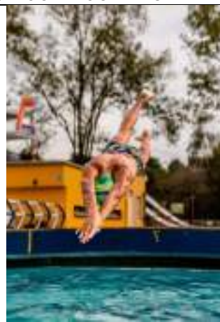
PARTICIPACIÓN LIGA DE TRIATLÓN