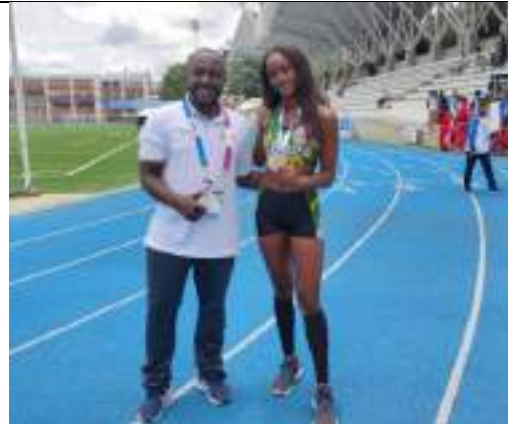
PARTICIPACIÓN LIGA DE ATLETISMO