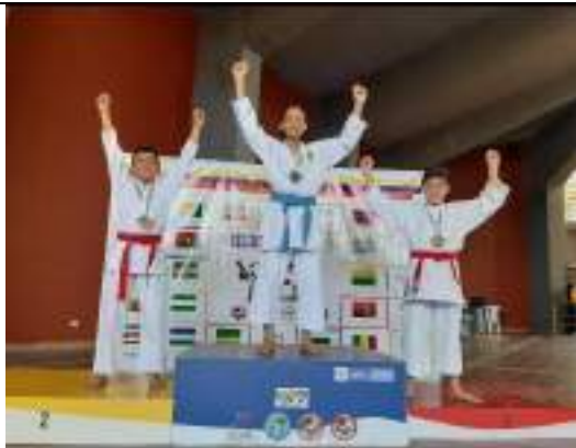
PARTICIPACIÓN NACIONAL LIGA DE KARATE-DO