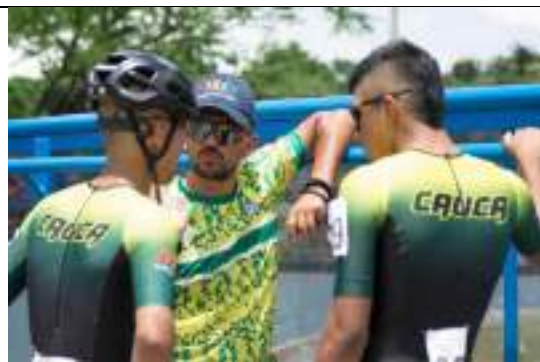
Participaciones deportistas caucanos en Campeonato Nacional interligas de patinaje 2022