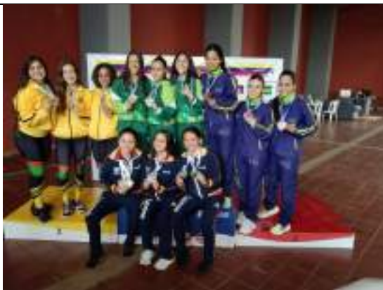
PARTICIPACIÓN NACIONAL LIGA DE KARATE-DO