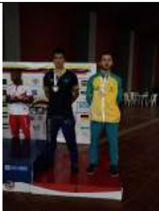
PARTICIPACIÓN NACIONAL LIGA DE KARATE-DO