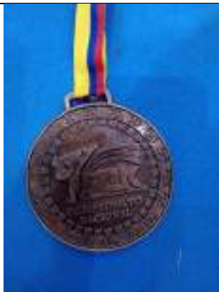
LOGROS CAMPEONATO NACIONAL DE KARATE-DO