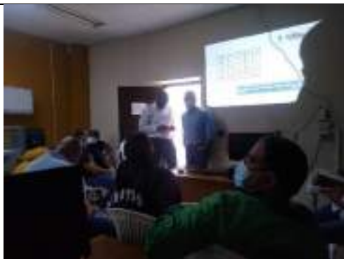
Reunión de entrenadores socialización Juegos Deportivos Nacionales 2023