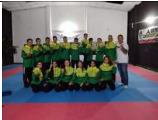
PARTICIPACIÓN NACIONAL LIGA DE KARATE-DO