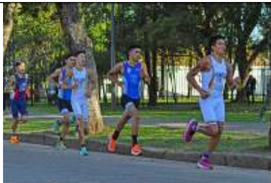
PARTICIPACIÓN LIGA DE TRIATLÓN