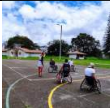
ENTRENAMIENTO LIGA DE PARA BALONCESTO