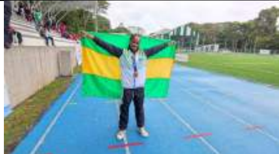
PARTICIPACIÓN JUEGOS INTERCOLEGIADOS SUPÉRATE