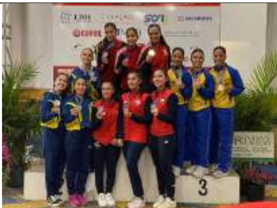
PARTICIPACIÓN LIGA DE KARATE-DO