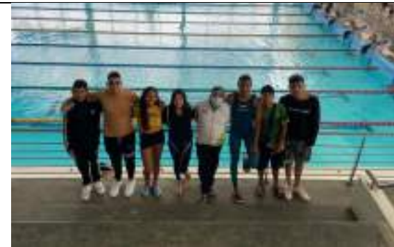
PARTICIPACIÓN LIGA DE SUBACUÁTICAS