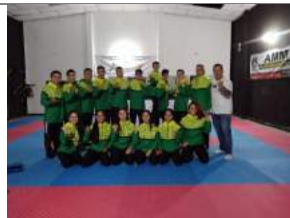
PARTICIPACIÓN NACIONAL LIGA DE KARATE-DO