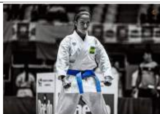
Campeonato Nacional Interligas de karate 2022 – modalidad Kata Individual