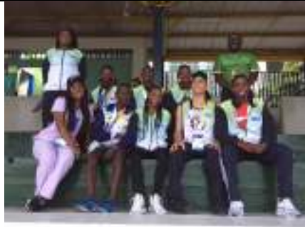
PARTICIPACIÓN JUEGOS INTERCOLEGIADOS SUPÉRATE