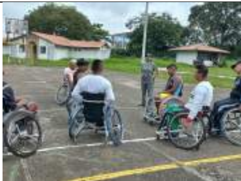
ENTRENAMIENTO LIGA DE PARA BALONCESTO