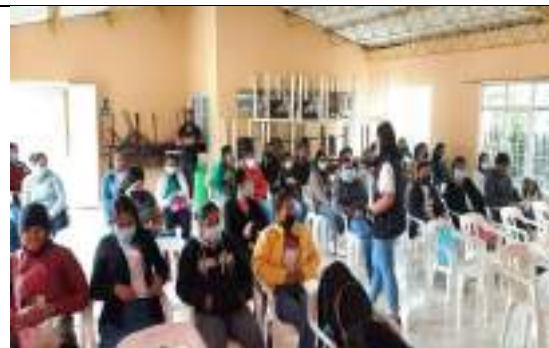
Capacitación Psicosocial padres de familia escuelas de formación deportiva Municipio de Timbio