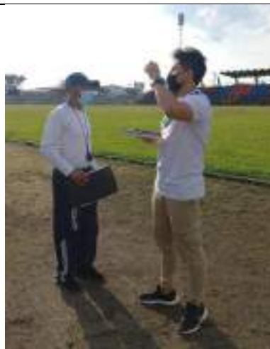
ENTRENAMIENTO LIGA DE ATLETISMO