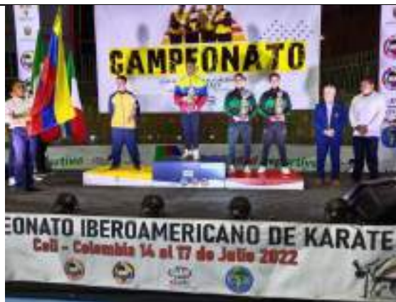
PARTICIPACIÓN IBEROAMERICANO DE KARATE-DO