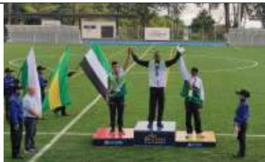
PARTICIPACIÓN JUEGOS INTERCOLEGIADOS SUPÉRATE