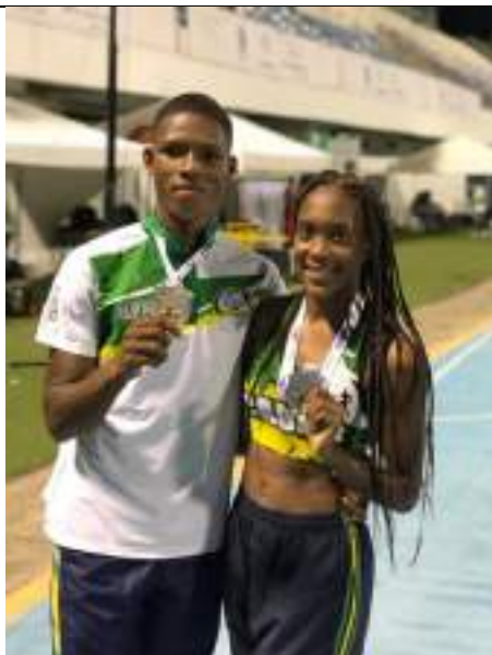
PARTICIPACIÓN LIGA DE ATLETISMO