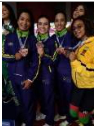
PARTICIPACIÓN NACIONAL LIGA DE KARATE-DO