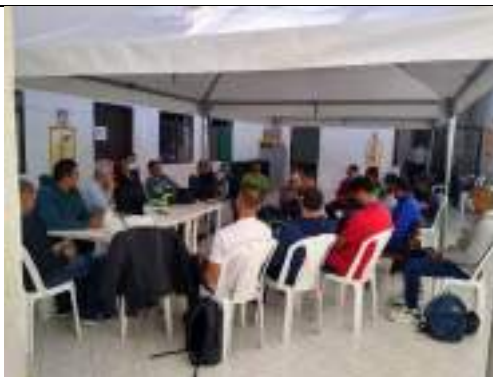
Reunión de entrenadores socialización Juegos Deportivos Nacionales 2023