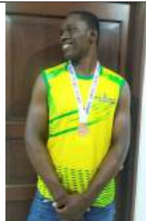
PARTICIPACIÓN LIGA DE PARA ATLETISMO