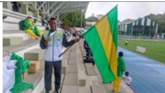
PARTICIPACIÓN JUEGOS INTERCOLEGIADOS SUPÉRATE