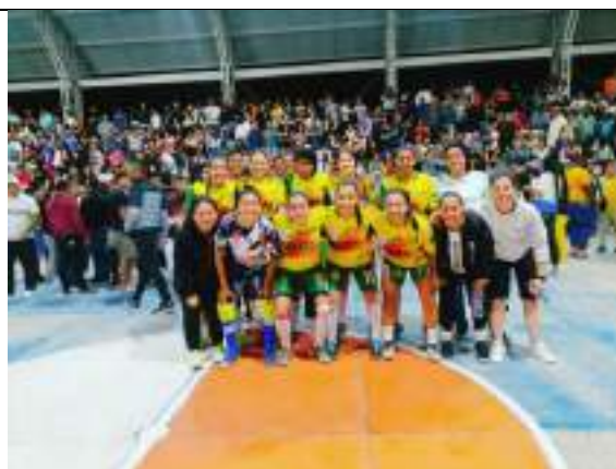
Copa Femenina de Futbol de salón Selección Cauca