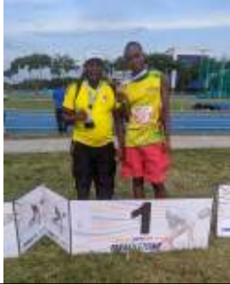
PARTICIPACIÓN LIGA DE PARA ATLETISMO