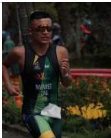
PARTICIPACIÓN LIGA DE TRIATLÓN