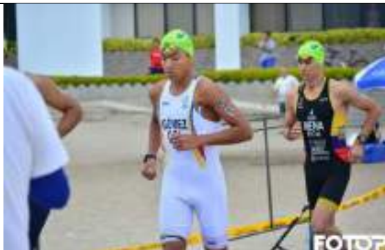
PARTICIPACIÓN LIGA DE TRIATLÓN