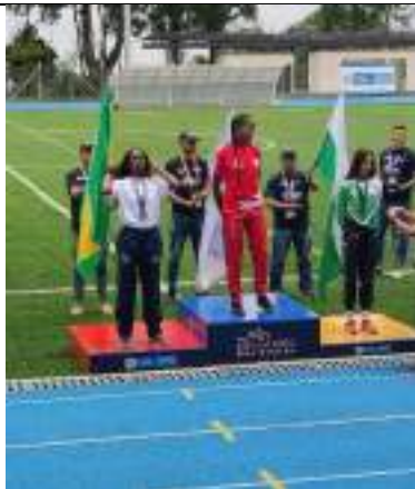
PARTICIPACIÓN JUEGOS INTERCOLEGIADOS SUPÉRATE