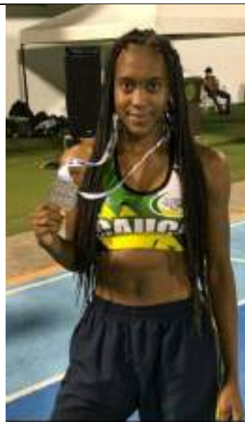
PARTICIPACIÓN LIGA DE ATLETISMO