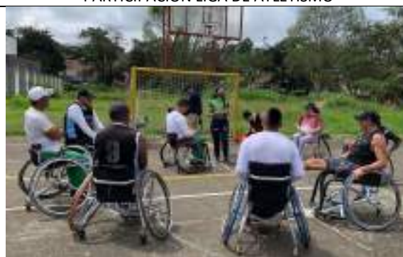
ENTRENAMIENTO LIGA DE PARA BALONCESTO