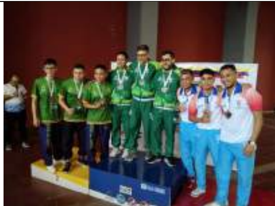
PARTICIPACIÓN NACIONAL LIGA DE KARATE-DO