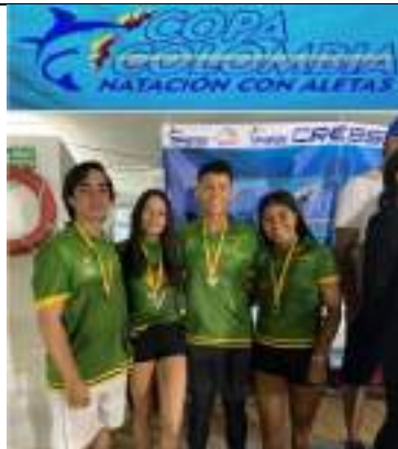
PARTICIPACIÓN NACIONAL LIGA DE SUBACUÁTICAS