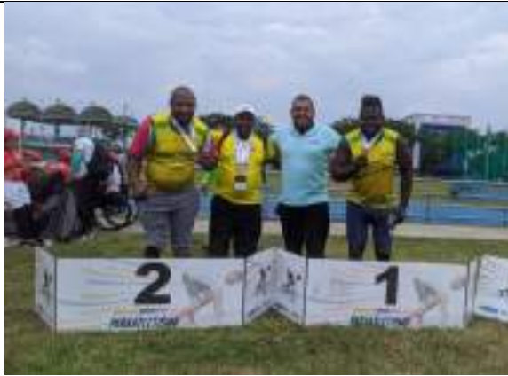
PARTICIPACIÓN LIGA DE PARA ATLETISMO