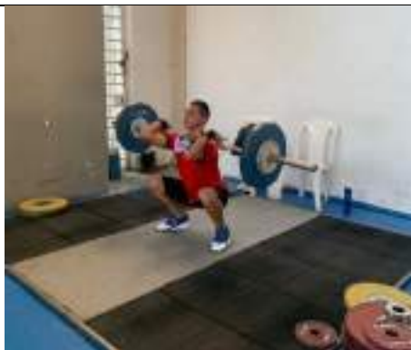
CONCENTRACIÓN NACIONAL LIGA DE PESAS