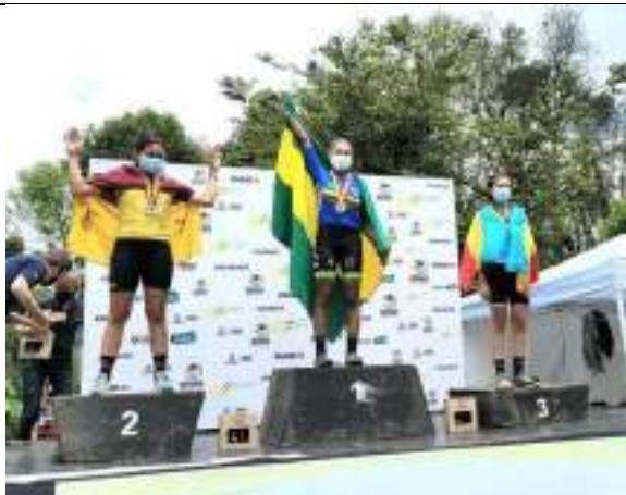
PARTICIPACIÓN NACIONAL LIGA DE CICLISMO