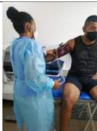
Evaluaciones Técnico Metodológicas a deportistas proyección a juegos deportivos nacionales