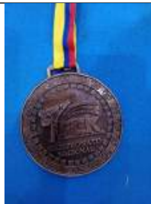
LOGROS CAMPEONATO NACIONAL DE KARATE-DO