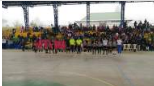
Juegos Intercolegiados Municipales Sotarí-Cauca