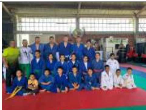
Campeonato Nacional Judo Pereira 2022