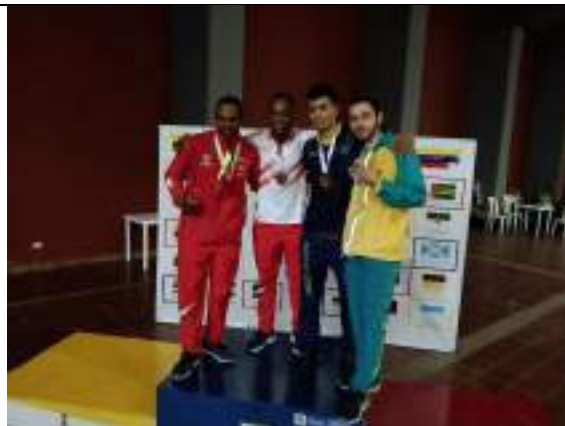
PARTICIPACIÓN NACIONAL LIGA DE KARATE-DO