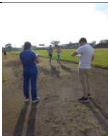
PARTICIPACIÓN LIGA DE ATLETISMO