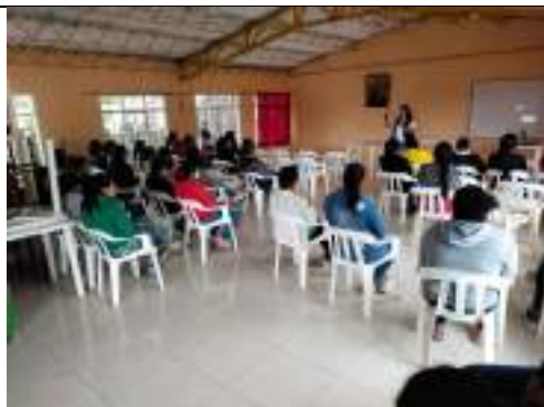
Capacitación Legislación deportiva municipio de Totoro