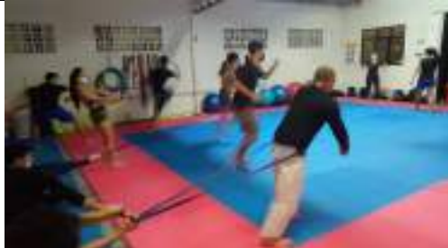
Preparación física específica deportistas proyección a juegos deportivos nacionales