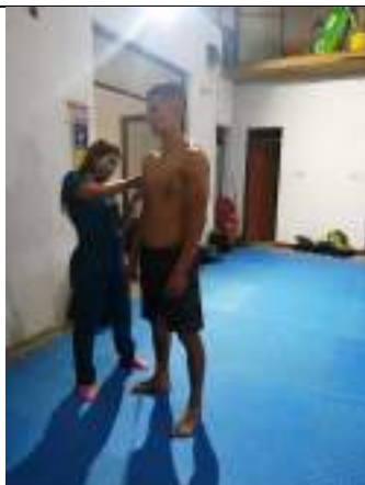
Evaluaciones Técnico Metodológicas a deportistas proyección a juegos deportivos nacionales