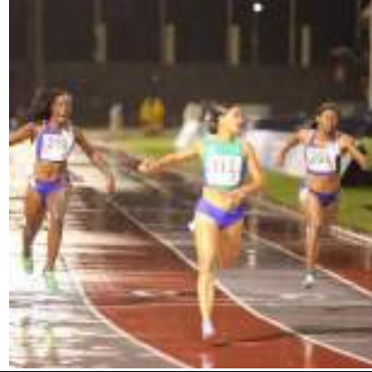
PARTICIPACIÓN LIGA DE ATLETISMO